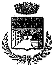
Comune di Piazza al Serchio