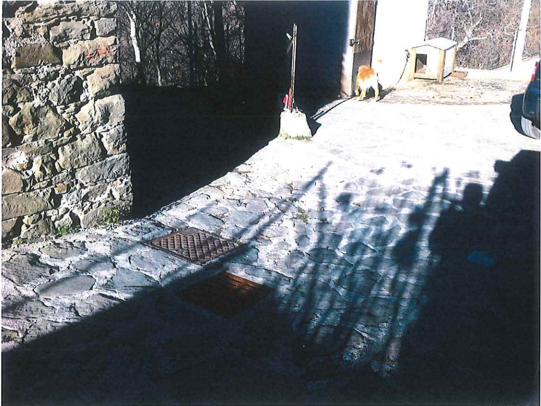
Foto_3 - stato attuale intervento 2