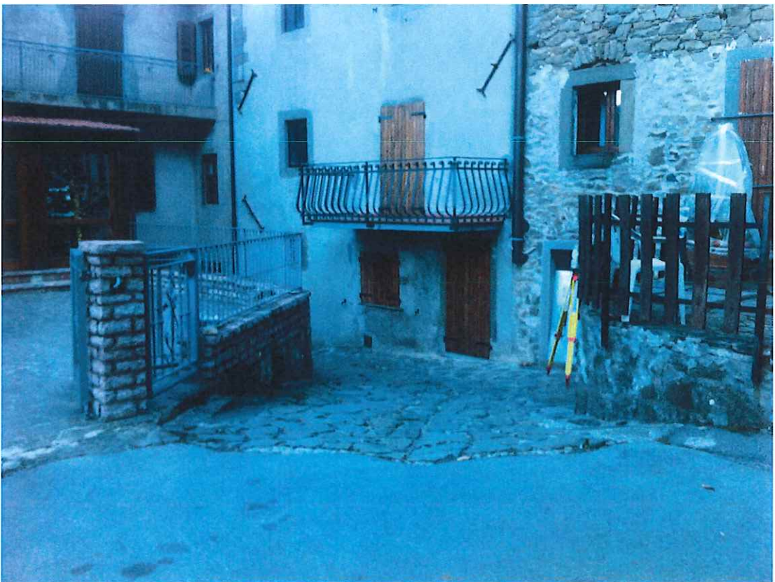
Foto_2 - stato attuale intervento 1