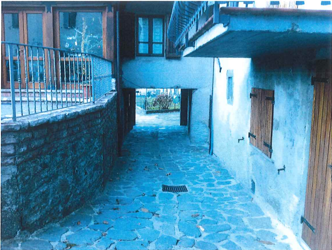
Foto_1 - stato attuale intervento 1