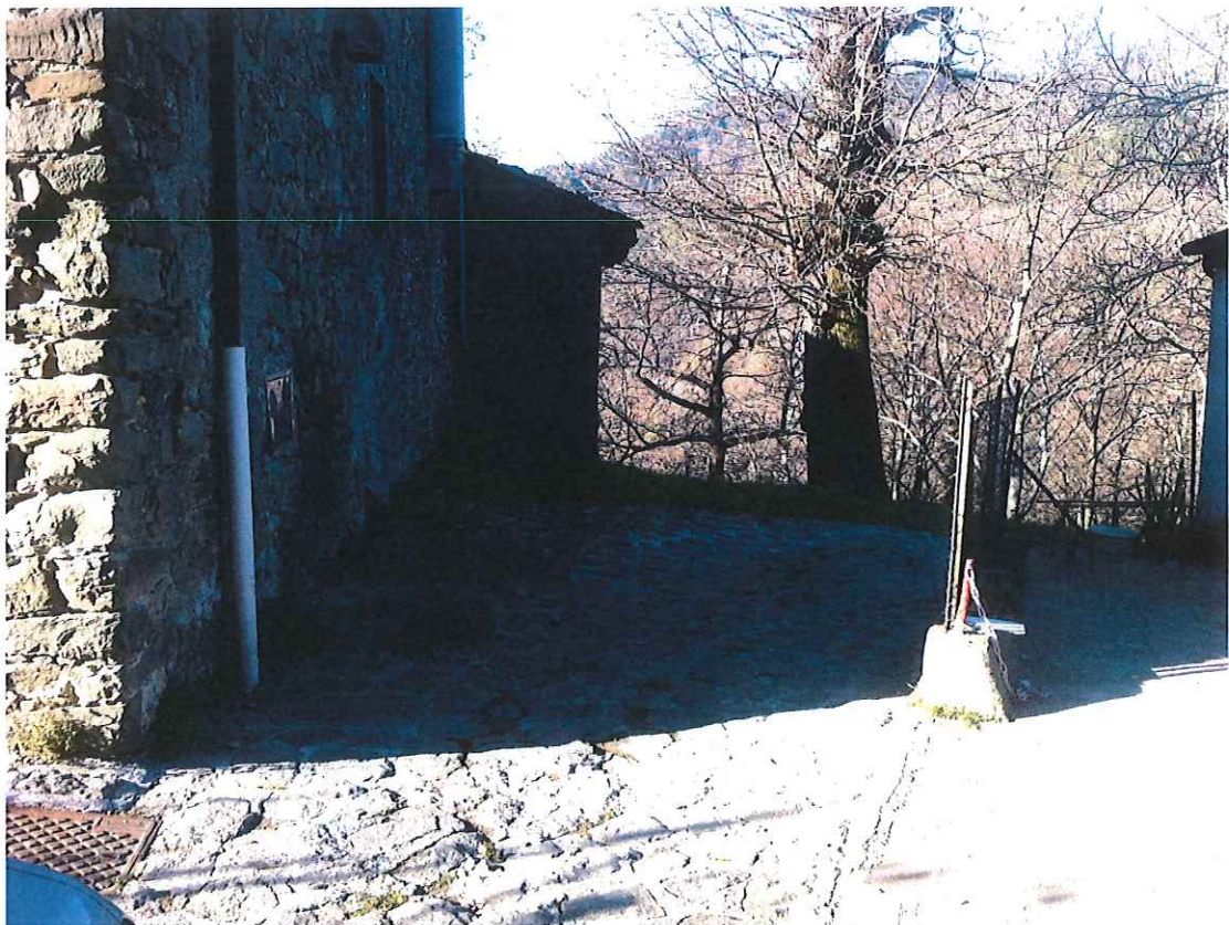
Foto_4 - stato attuale intervento 2